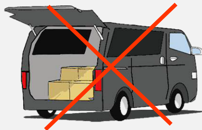
荷物の積みすぎによる 重量オーバー車